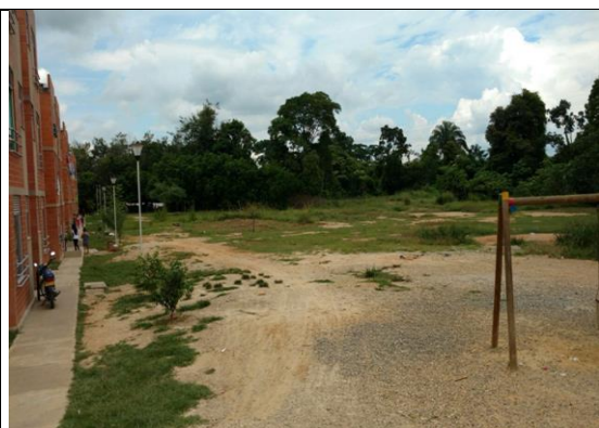
Fotografía 2. Predio donde se ejecutará el proyecto.

Ubicación del Lote: El lote en el cual se desarrollará el proyecto corresponde al predio con matrícula inmobiliaria No. 366-47432, de propiedad del municipio de Carmen de Apicalá, con un área es de 2.406,53 m 2 .