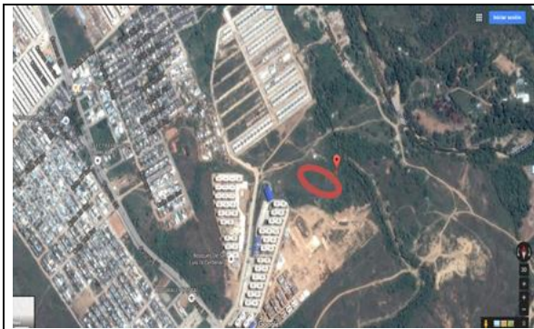
Fotografía 1. Vista aérea localización proyecto.