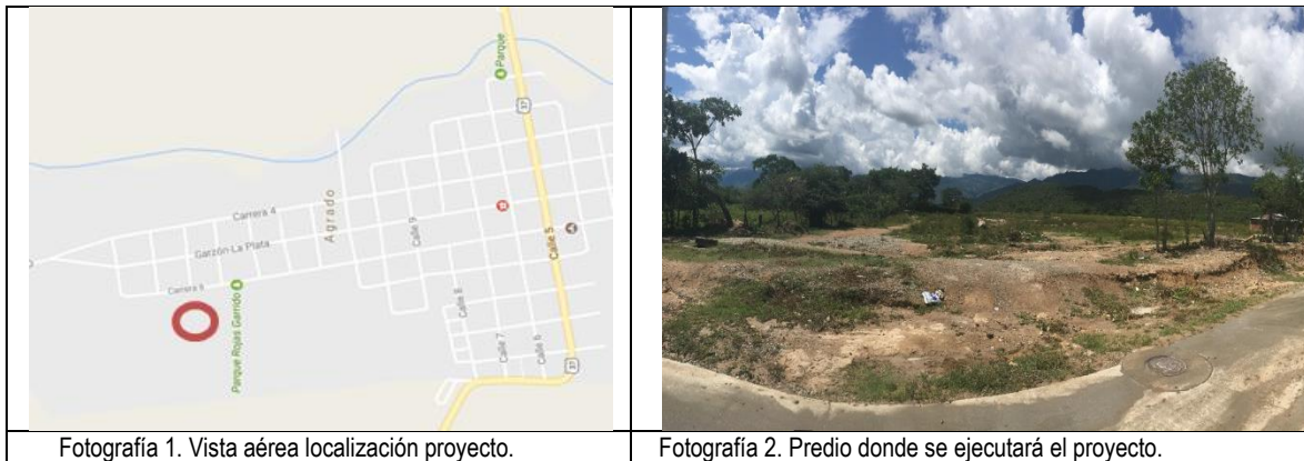
Fotografía 1. Vista aérea localización proyecto.

La ejecución de la infraestructura objeto de la presente convocatoria se llevará a cabo en el lote identificado bajo la Matrícula Inmobiliaria No. 202-70847 de la Oficina de instrumentos Públicos de El Agrado, propiedad del municipio de El Agrado con área de 11.078,46 m 2 , con un área de intervención de 3.000 m 2 .