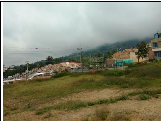
Fotografía 2. Predio donde se ejecutará el proyecto.

Ubicación del Lote: El lote en el cual se desarrollará el proyecto corresponde al predio con matrícula inmobiliaria No. 157 - 134515, de propiedad del municipio de Fusagasugá, con un área es de 5.000 m 2 .