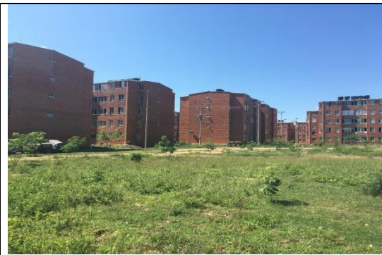
Fotografía 2. Predio donde se ejecutará el proyecto.

Ubicación del Lote: El lote en el cual se desarrollará el proyecto corresponde al predio con matrícula inmobiliaria No. 200-232793 y 200-232795, de propiedad del municipio de Neiva, con un área es de 8.310,37 m 2 , con un área de intervención de 4.000 m 2