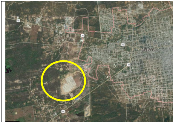
Fotografía 1. Vista aérea localización proyecto.