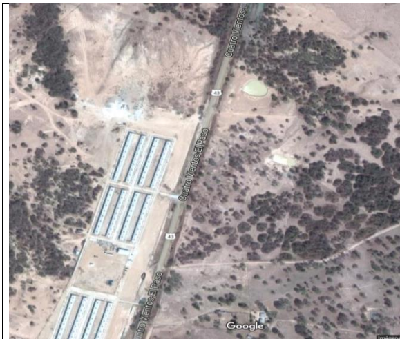
Fotografía 1. Vista aérea localización proyecto.