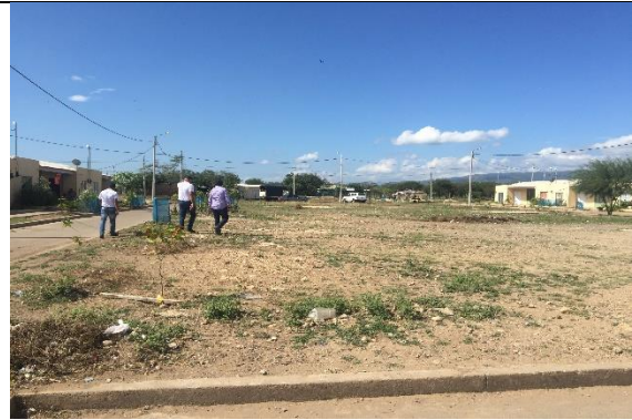
Fotografía 2. Predio donde se ejecutará el proyecto.