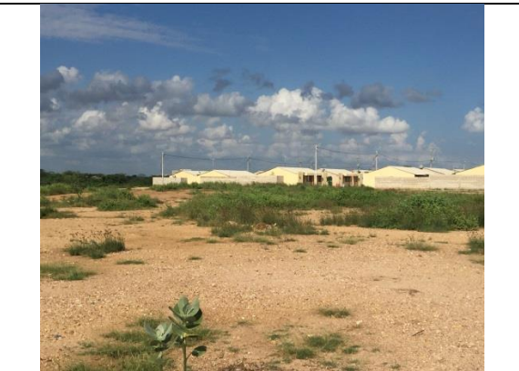
Fotografía 2. Predio donde se ejecutará el proyecto.