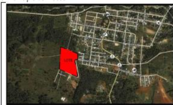
Fotografía 1. Vista aérea localización proyecto.

La ejecución de la infraestructura objeto de la presente convocatoria se llevará a cabo en el lote identificado bajo la Matrícula Inmobiliaria No. 440-72597 de la Oficina de instrumentos Públicos de Mocoa, con área de 2.999,05 m 2 propiedad del municipio de Mocoa