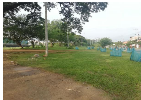
Fotografía 2. Vista general del predio