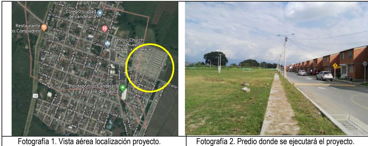
Fotografía 1. Vista aérea localización proyecto.