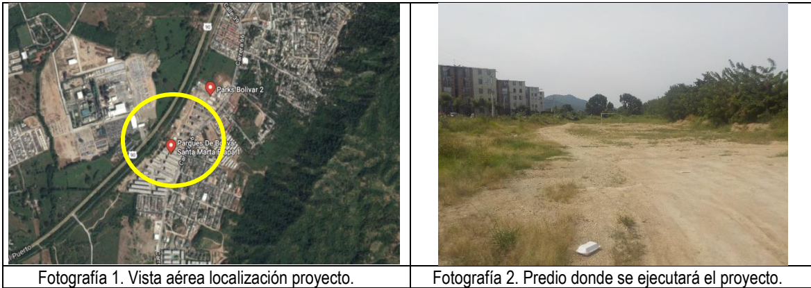
Fotografía 1. Vista aérea localización proyecto.