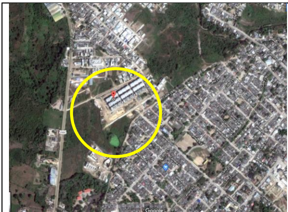
Fotografía 1. Vista aérea localización proyecto.