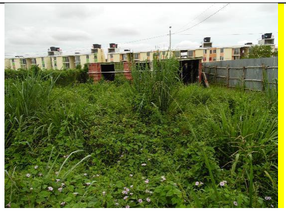
Fotografía 2. Predio donde se ejecutará el proyecto.