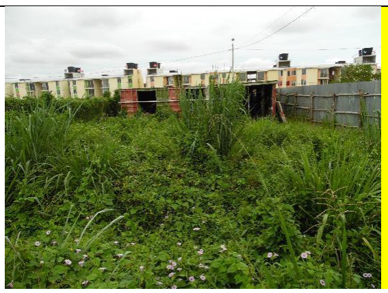
Fotografía 2. Predio donde se ejecutará el proyecto.