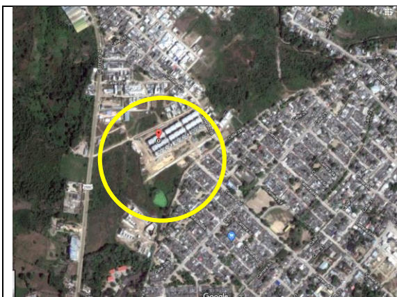
Fotografía 1. Vista aérea localización proyecto.