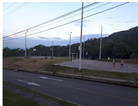
Fotografía 2. Vista actual del predio