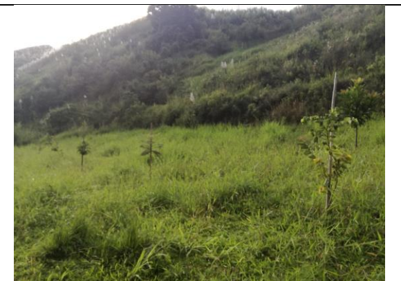
Fotografía 2. Predio donde se ejecutará el proyecto.