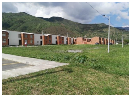
Fotografía 2. Predio donde se ejecutará el proyecto.