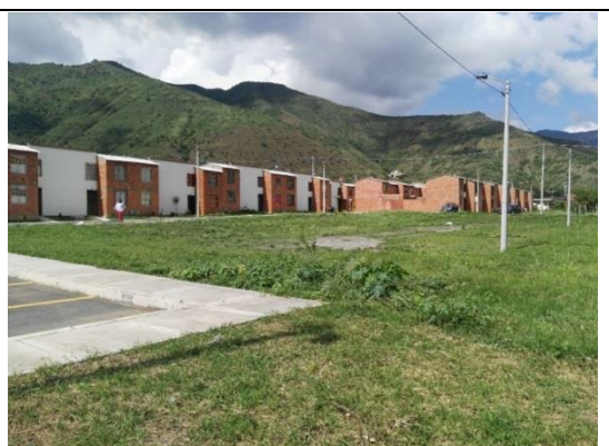
Fotografía 2. Predio donde se ejecutará el proyecto.