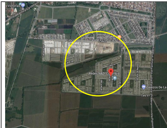
Fotografía 1. localización proyecto.