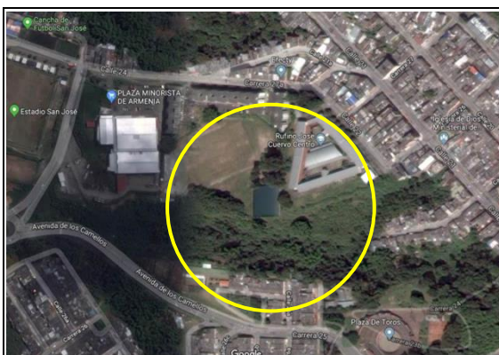
Fotografía 1. Vista aérea localización proyecto.