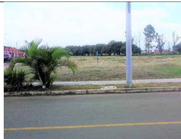
Fotografía 2. Predio donde se ejecutará el proyecto.