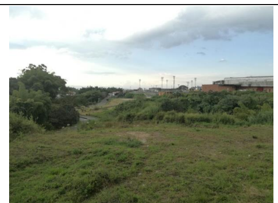
Fotografía 2. Predio donde se ejecutará el proyecto.