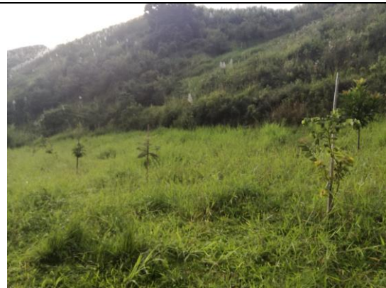
Fotografía 2. Predio donde se ejecutará el proyecto.