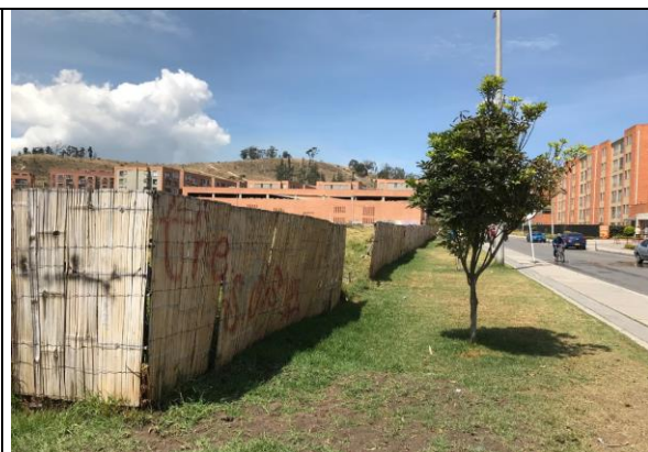
Fotografía 2. Vista actual del predio