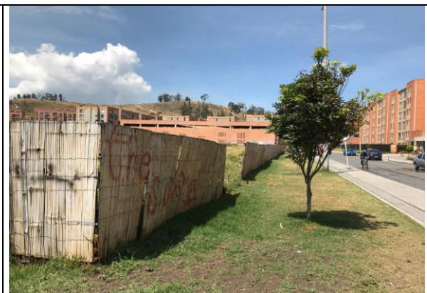
Fotografía 2. Vista actual del predio