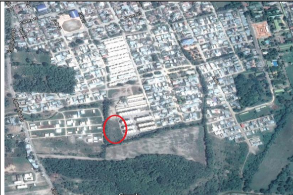
Fotografía 1. Localización proyecto-Urbanización Luis Carlos Galán Sarmiento.