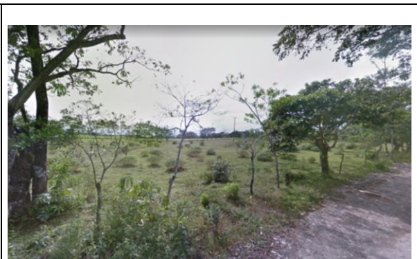
Fotografía 2. Vista del predio