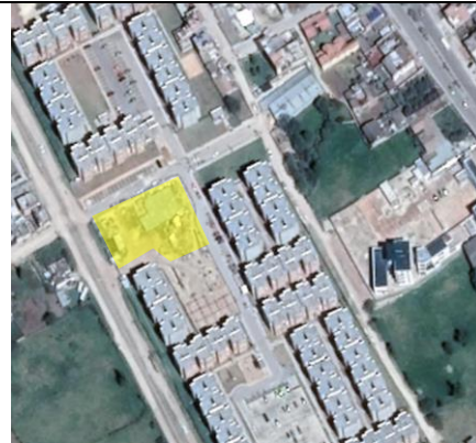
Fotografía 2. Vista general del predio

Ubicación del Lote: El lote en el cual se desarrollará el proyecto corresponde al predio con matrícula Inmobiliaria No. 074-102680 de la Oficina de instrumentos Públicos de Duitama, con área total de 3.772.35 m 2 aproximadamente, propiedad del municipio de Duitama.