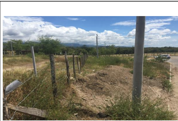
Fotografía 2. Vista del predio

Ubicación del Lote: El lote en el cual se desarrollará el proyecto corresponde al predio con matrícula Inmobiliaria No. 350-242578 de la Oficina de instrumentos Públicos de Alvarado, con área total de 669.92 m2 aproximadamente, propiedad del municipio de Alvarado.