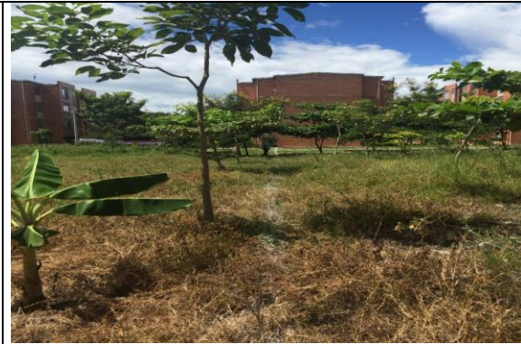
Fotografía 2. Vista del predio-Oriente del Lote al lado de la Urb. Luis Carlos Galán

Ubicación del Lote: El lote en el cual se desarrollará el proyecto corresponde al predio con matrícula Inmobiliaria No. 357-62027 de la Oficina de instrumentos Públicos de Espinal, con área total de 12.263.93 m 2 aproximadamente, propiedad del municipio de Espinal.