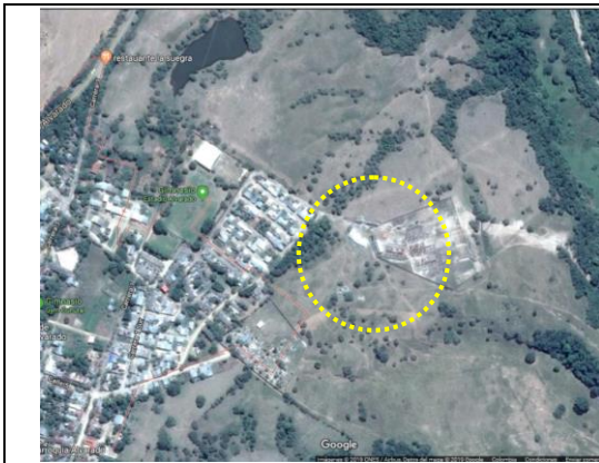
Fotografía 1. Localización-Urbanización reservas de san Fernando