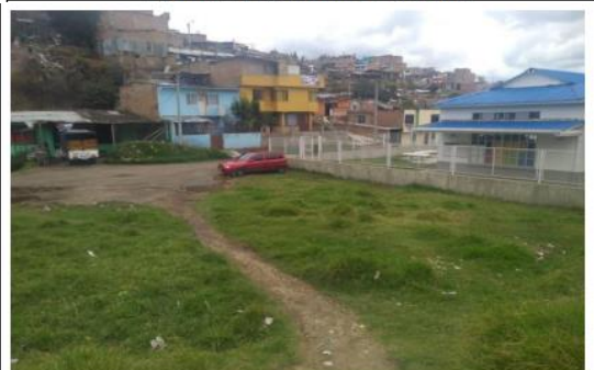
Via peatonal en rebecho costado oriente