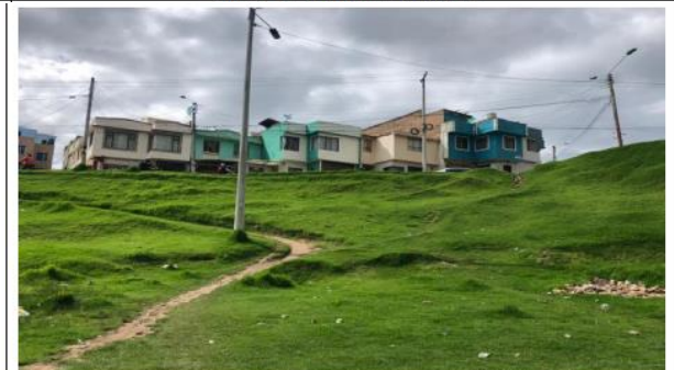
Redes de Energía Electrica en el predio