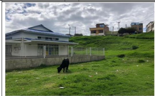
Biblioteca Municipal de Aranda ubicada en el costado Sur.