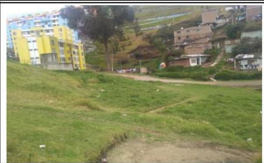
Acceso peatonal por el costado Norte