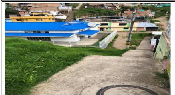
Acceso peatonal por el costado Sur.