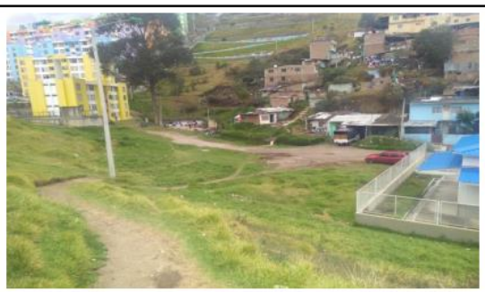
Vista General del Lote