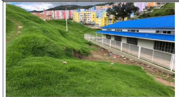
Preexistencia: Biblioteca Municipal de Aranda