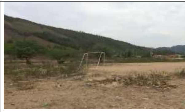
Fotografía 2. Vista del predio