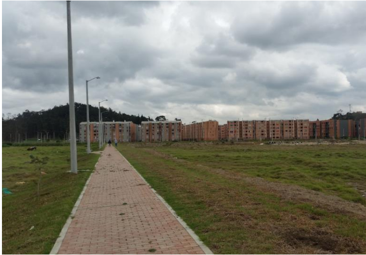
Figura 3 Localización predio para Colegio – Urbanización Torrentes