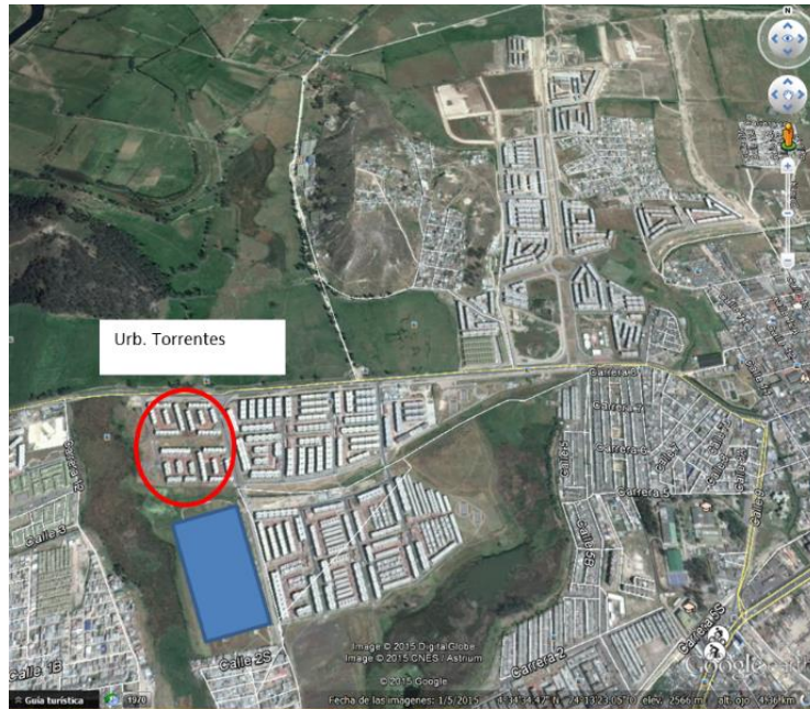
Figura 1 Localización predio para Colegio – Urbanización Torrentes