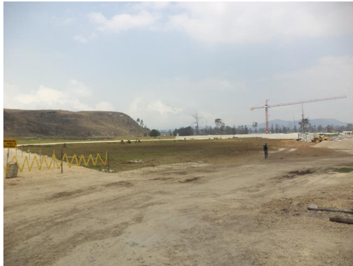
Figura 4 Localización predio para Colegio y Centro de Desarrollo Infantil – Urbanización Vida Nueva