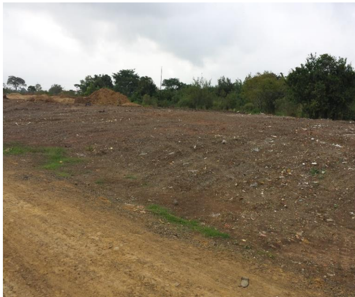
Figura 2 Localización predio para colegio y Centro de Desarrollo Infantil (CDI)