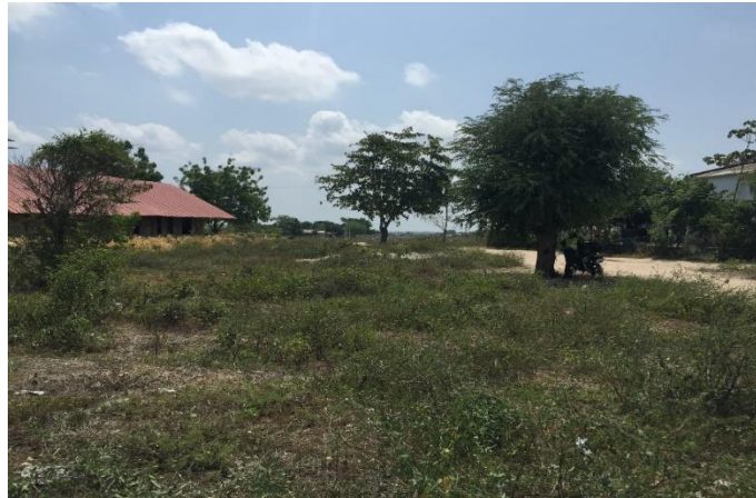
Figura 2 Localización predio para Centro de Desarrollo Infantil (CDI)