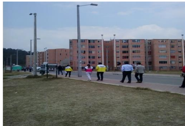
Figura 4. Localización de predio para Centro de Desarrollo Infantil (CDI) del municipio de Soacha