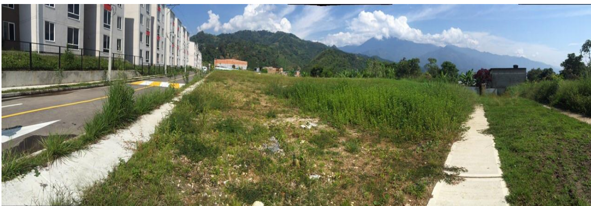
Figura 2. Localización de predio para Centro de Desarrollo Infantil (CDI) del municipio de Soacha