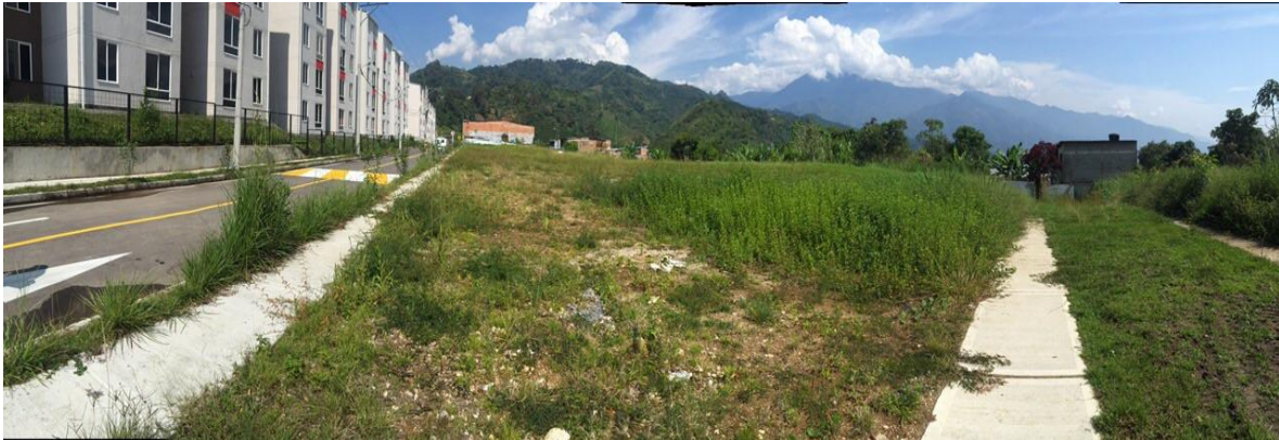
Figura 2 Localización de predio para Centro de Desarrollo Infantil (CDI)