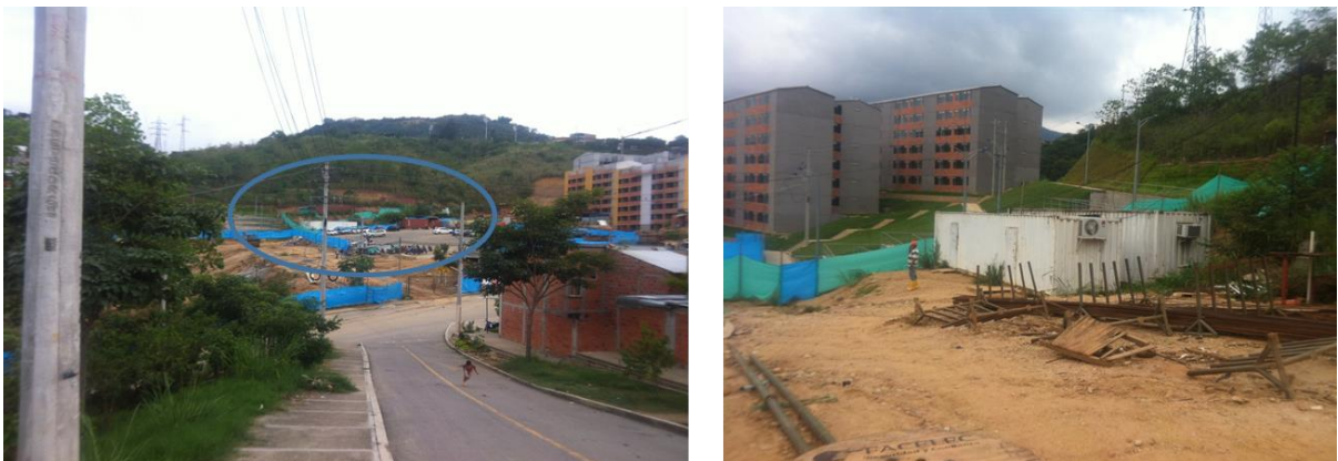
Figura 2 Localización de predio para Centro de Desarrollo Infantil (CDI)