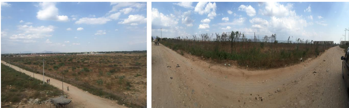
Ilustración 2 Localización de predio para Colegio y Centro de Desarrollo Infantil (CDI)