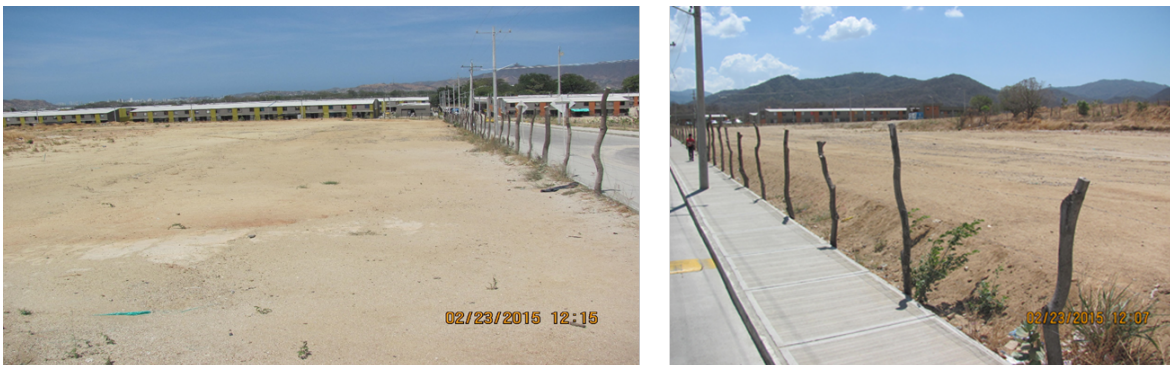
Ilustración 2 Localización de predio para Colegio y Centro de Desarrollo Infantil (CDI)