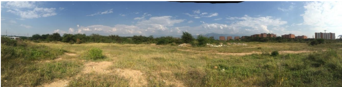
Ilustración 4 Localización de predio para Centro de Desarrollo Infantil (CDI) - Neiva