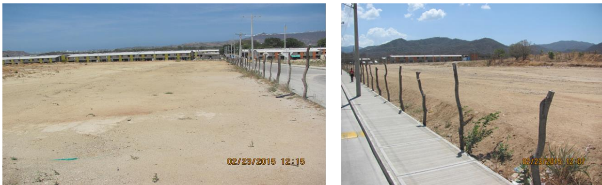
Figura 2 Localización de predio para Colegio y Centro de Desarrollo Infantil (CDI)