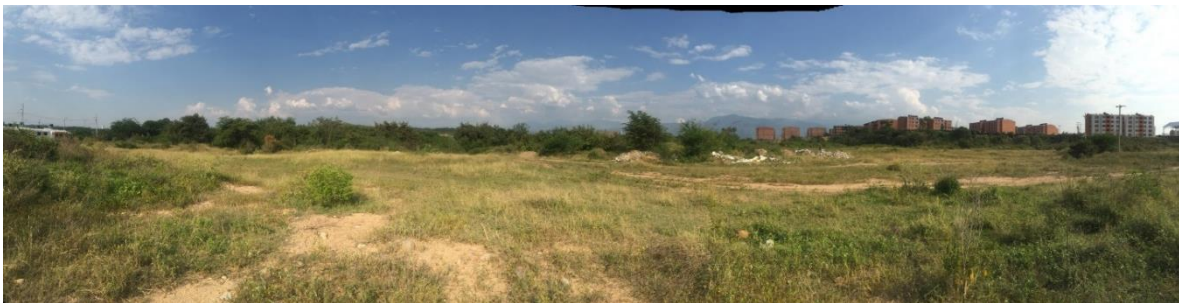
Figura 2 Localización de predio para Centro de Desarrollo Infantil (CDI)