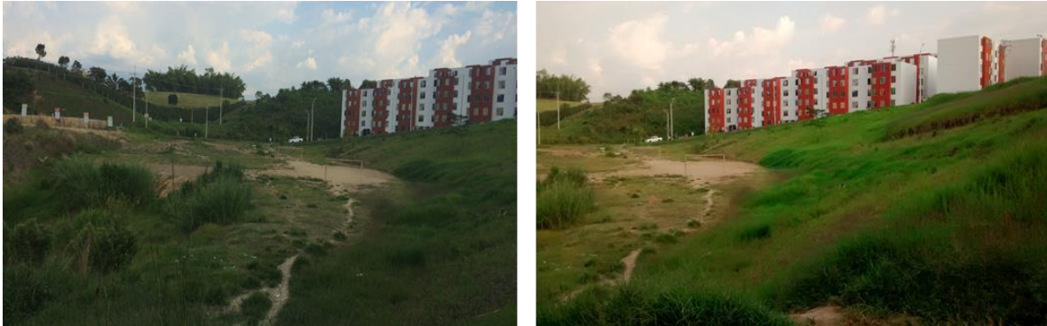
Figura 2 Localización de predio para Colegio y Centro de Desarrollo Infantil (CDI)