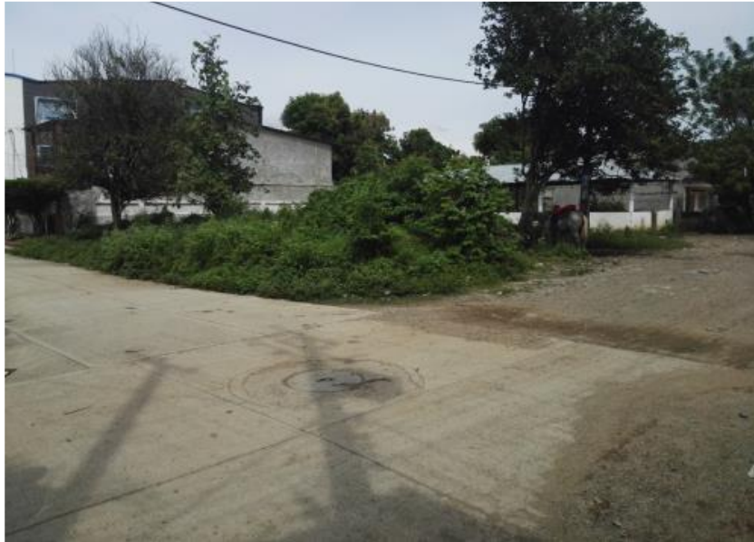
Figura 1. Tomada del informe de visita- julio de 2016.