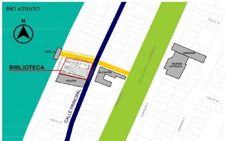
Figura 3. Localización de la Biblioteca en el Municipio

La biblioteca pública municipal de Vigía del Fuerte en el Departamento de Antioquia, se encuentra en la Carrera 2, Calle 18 esquina, sobre la entrada principal al casco urbano llegando por el río Atrato, dentro de su entorno inmediato se encuentra sobre la vía principal de comercio, al frente la Alcaldía y enseguida el Comando de Policía, contando con vías pavimentadas y cuenta un área de 196m 2 .