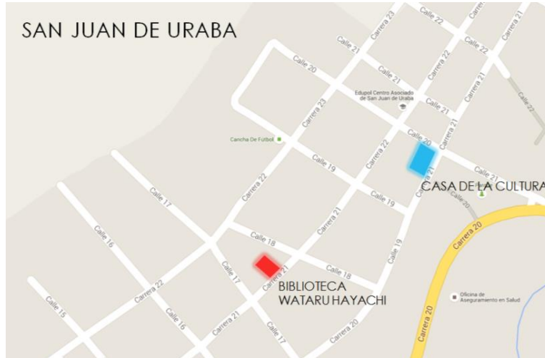
Figura 5. Localización de la Biblioteca en el Municipio