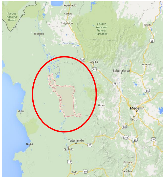
Figura 1. Localización del Municipio Vigía del Fuerte en el Departamento de Antioquia