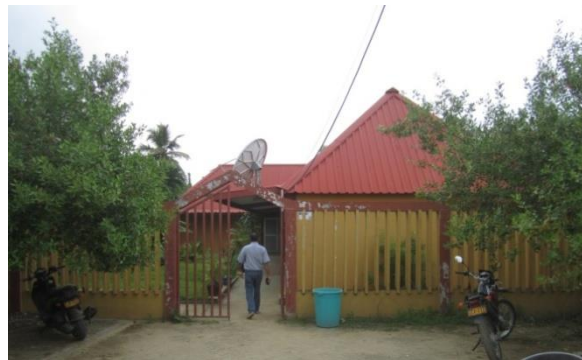
Figura 6. Biblioteca Municipal