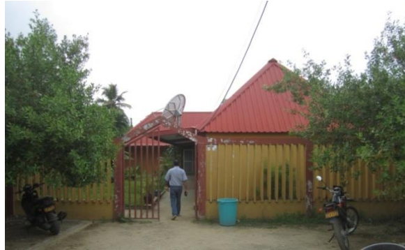
Figura 6. Biblioteca Municipal