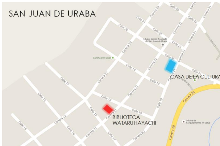
Figura 5. Localización de la Biblioteca en el Municipio

La biblioteca pública municipal de San Juan de Urabá en el Departamento de Antioquia, se encuentra en ubicada en Barrio Centro en la Cr. 21 No.18-59.