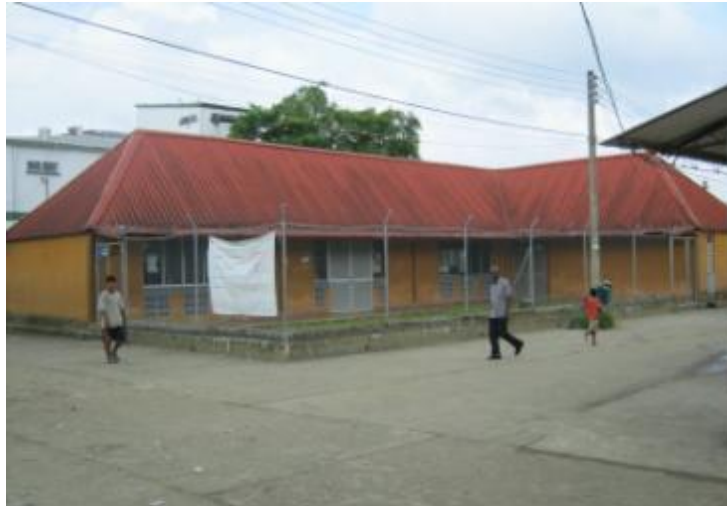
Figura 4. Biblioteca Municipal