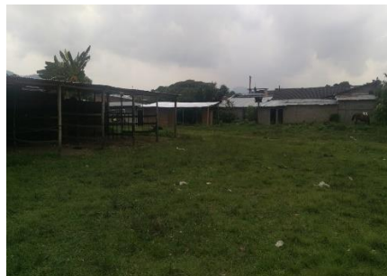
Imagen 2. Vista del predio