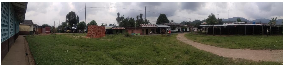
Imagen 4. Vista del predio