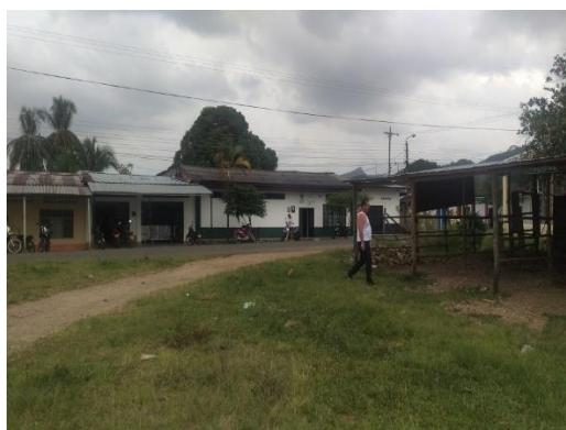
Imagen 3. Vista del predio