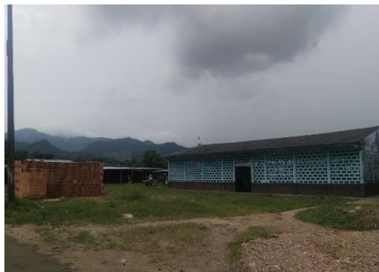
Imagen 1. Vista del predio