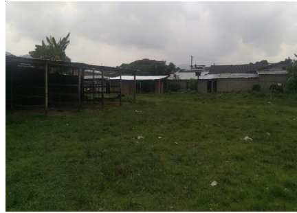
Imagen 2. Vista del predio