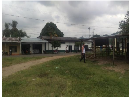
Imagen 3. Vista del predio