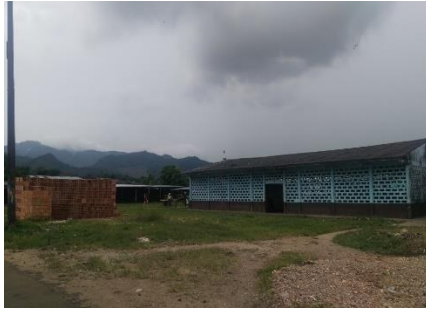
Imagen 1. Vista del predio