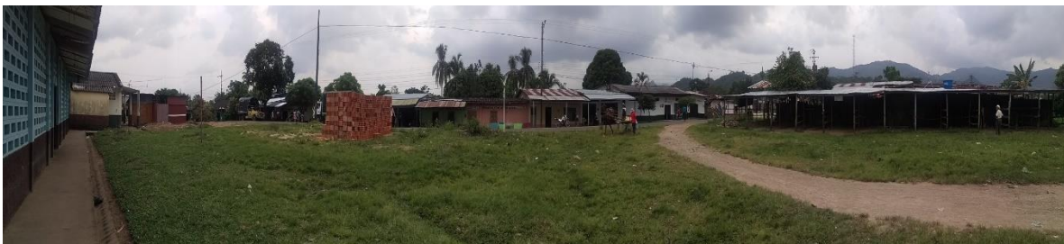
Imagen 4. Vista del predio