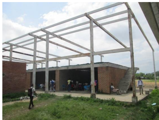
Imagen Estado actual de la Infraestructura