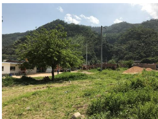
Imagen 2. Vista del predio