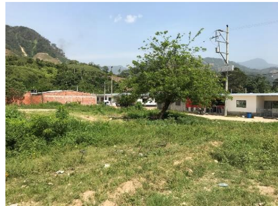
Imagen 3. Vista del predio