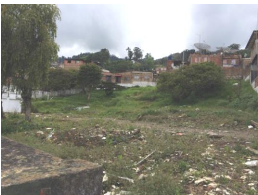
Imagen 2. Vista del predio