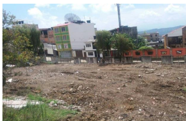
Imagen 3. Vista del predio