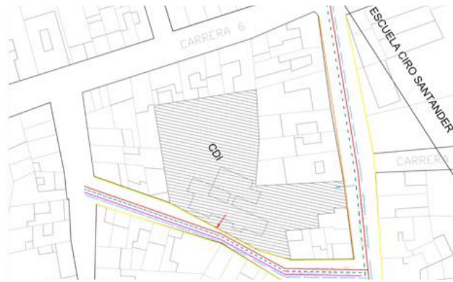
Imagen 1. Localización del predio