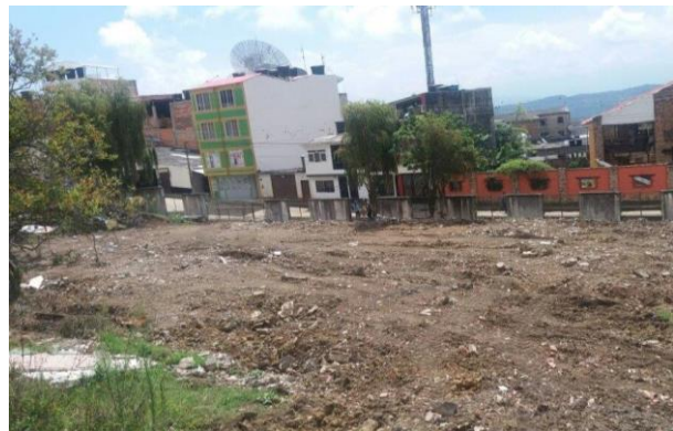
Imagen 3. Vista del predio