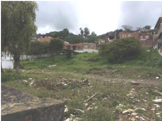
Imagen 2. Vista del predio