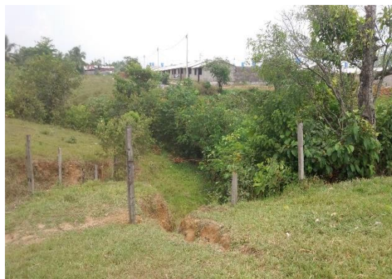
Imagen 2. Vista del predio