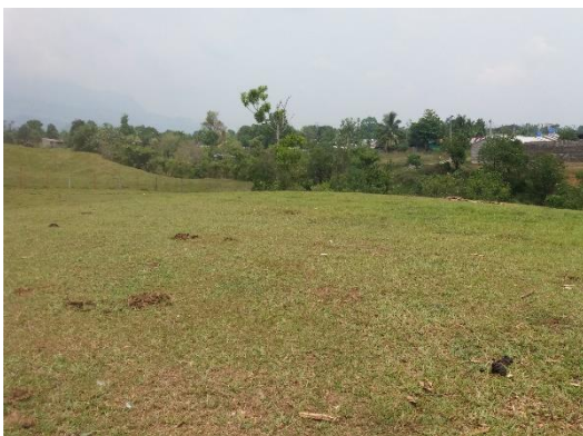
Imagen 1. Vista del predio