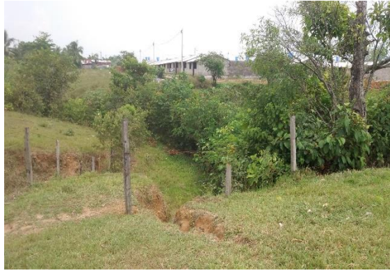
Imagen 2. Vista del predio