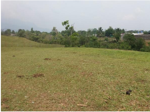
Imagen 1. Vista del predio