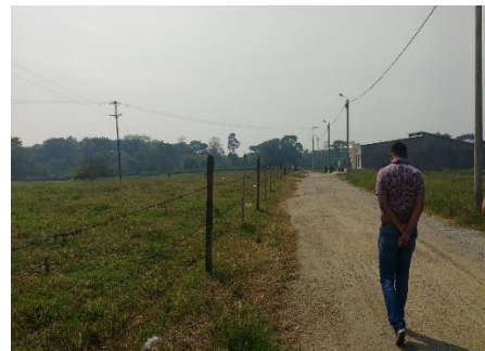
Imagen 2. Vista del predio