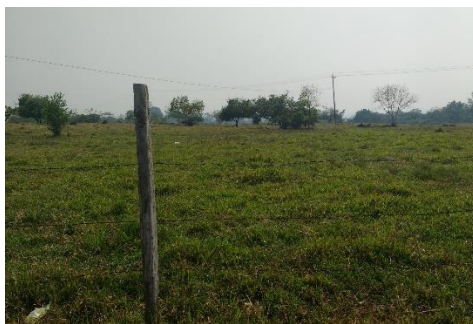
Imagen 1. Vista del predio