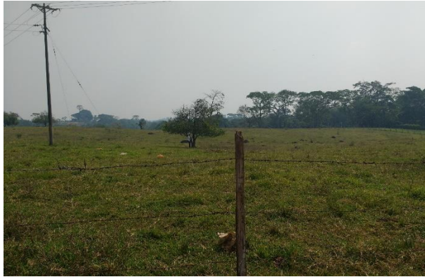
Imagen 3. Vista del predio