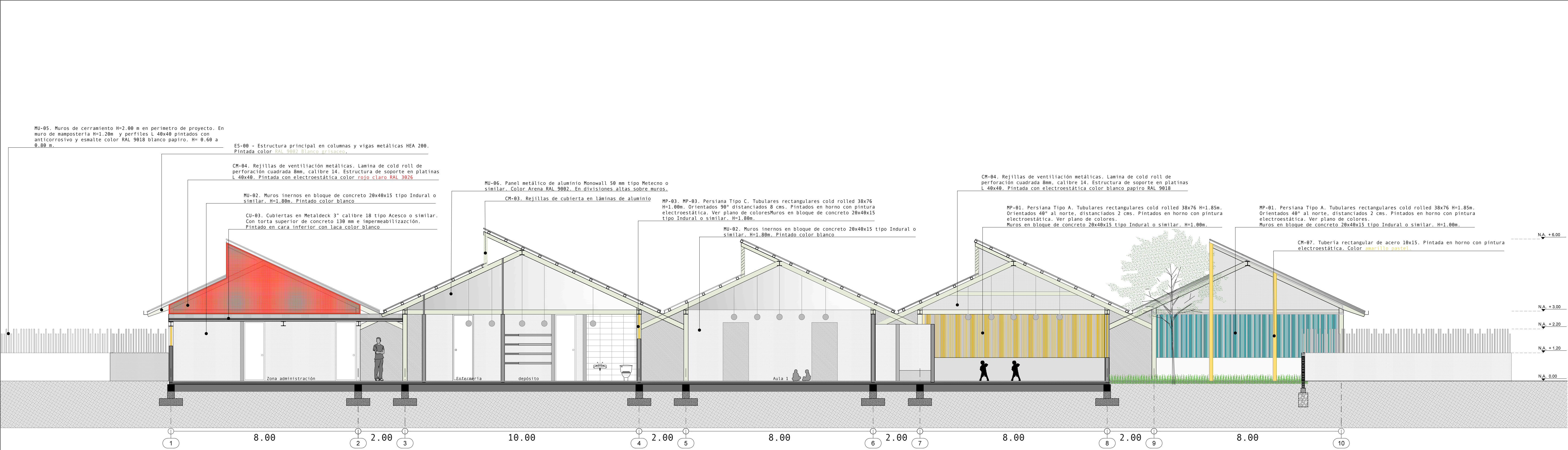
CORTE TRANSVERSAL AA ESC 1:75