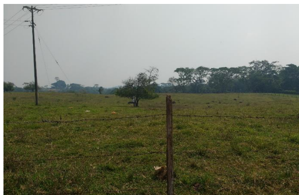
Imagen 3. Vista del predio