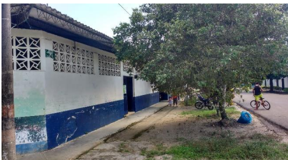
Imagen 1. Vista del predio