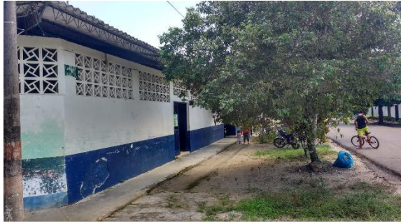
Imagen 1. Vista del predio