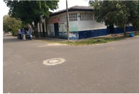
Imagen 2. Vista del predio