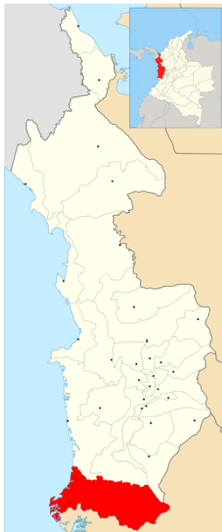
Localización del municipio del Litoral del San Juan

Por el río San Juan aguas arriba se puede llegar hasta la ciudad de Istmina en un recorrido aproximado de unas 7 horas en lanchas rápidas con motores fuera de borda que prestan diariamente este servicio cubriendo la ruta Istmina - Palestina (corregimiento de Litoral del San Juan) - Bajo Calima (corregimiento de Buenaventura). Desde Istmina se puede acceder en unas 2 horas, por una carretera pavimentada en buen estado, hasta la ciudad de Quibdó, capital del Departamento. Este recorrido es totalmente por vía fluvial.