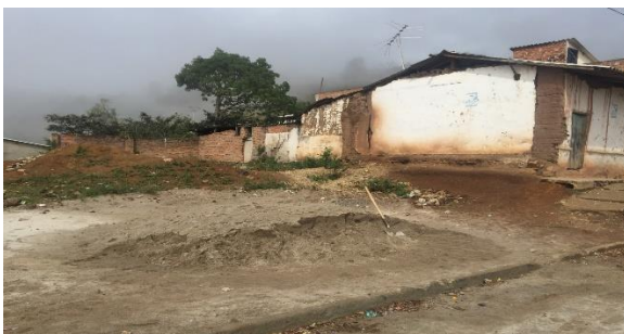
Imagen 1. Vista frontal del lote