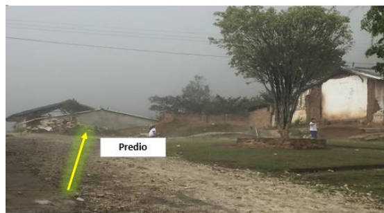
Imagen 2. Entrada al predio del proyecto