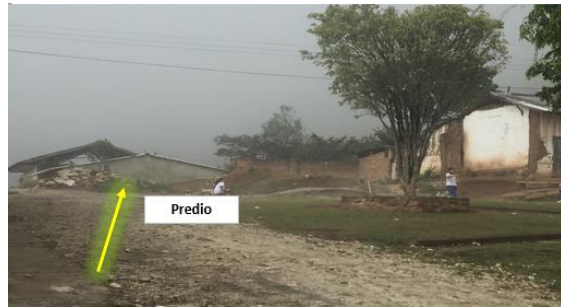
Imagen 2. Entrada al predio del proyecto