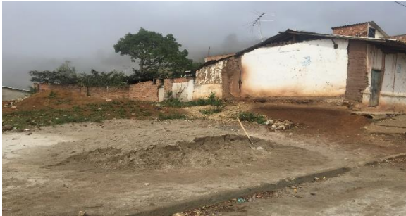
Imagen 1. Vista frontal del lote

Ubicación del Lote: El lote en el cual se desarrollará el proyecto corresponde al predio con matricula inmobiliaria N° 248-29086 de propiedad del Municipio de SAN LORENZO, con un área aproximada de 257m 2 .