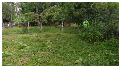
Localización General del Predio