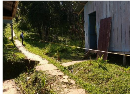
Localización General del predio.