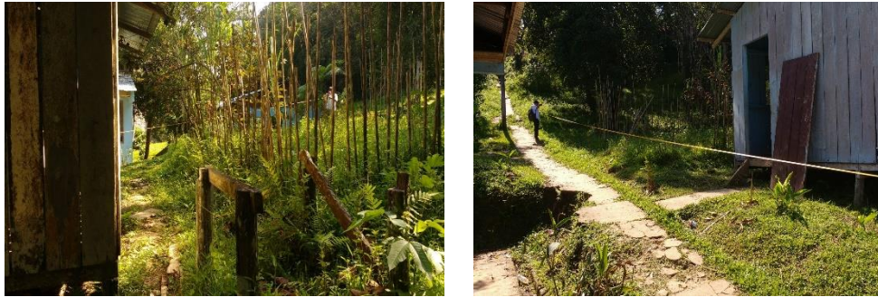
Localización General del predio.

Las vías de comunicación con el resguardo son en su totalidad fluviales. La principal arteria fluvial de comunicación es el río Amazonas en cuyas orillas se establece el resguardo indígena.