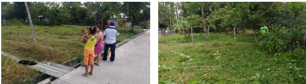
Localización General del Predio

Ubicación del Lote: El lote en el cual se desarrollará el proyecto corresponde al predio con matrícula inmobiliaria N°400-644 de propiedad de la comunidad indígena Ticuna Huitoto, ubicado en el kilómetro 6 de la vía Leticia – Tarapacá, Leticia – Amazonas.