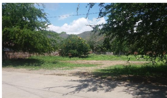
Imagen 2. Entrada al predio del proyecto